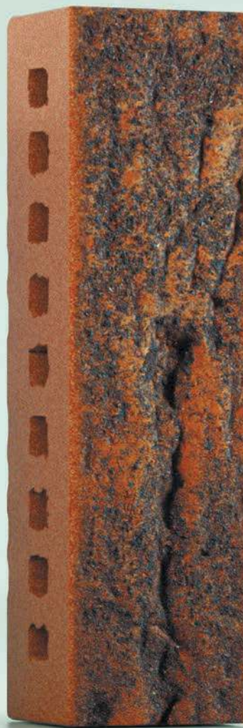
Формат 0.5 NF

Размер 215x102x65 Масса 2,55 кг На поддоне 428 шт. Расход 57 шт/м 2